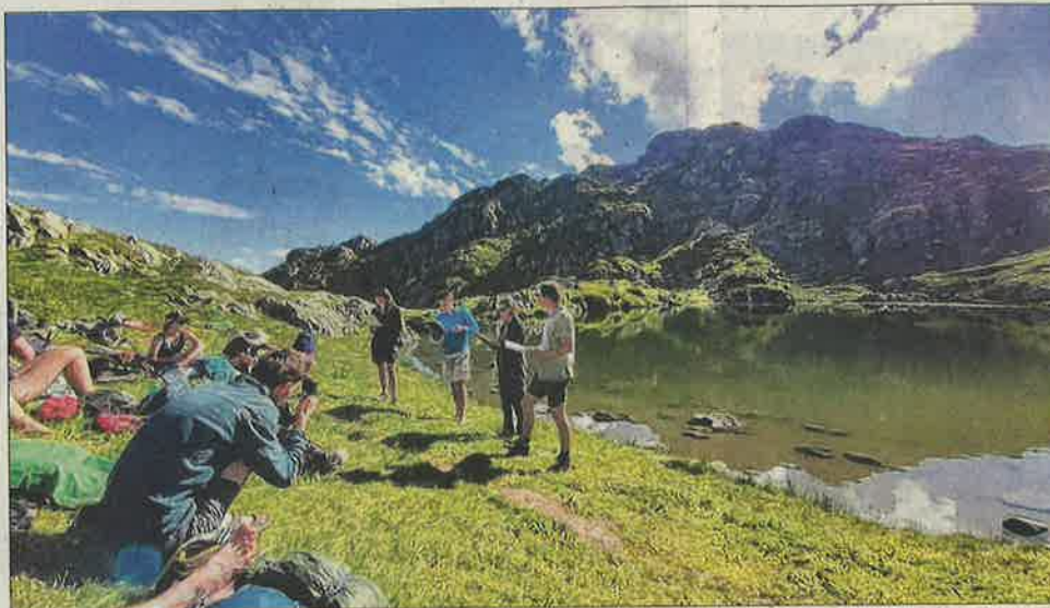
Les comédiens et le metteur en scène testent leur écriture lors d'une restitution au Lac de Crop.