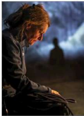
« Mort d'une Montagne », à voir au TNP.

À cette occasion, venez découvrir « Mort d'une montagne », le spectacle réalisé par Jérôme Cochet et François Hien de la Compagnie des Non-Alignés. La pièce nous amène dans un massif imaginaire, le massif des Hautes Aigues. On découvre le petit vil-