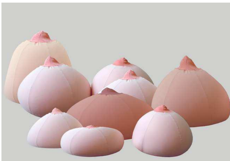
essais

La scénographie offre une palette de nuances, un paysage adapté et stimulant pour les enfants.