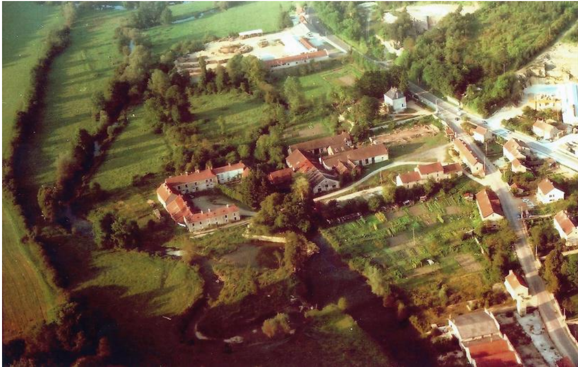
La "Pointerie", site industriel implanté à Chamesson, ayant inspiré la pièce