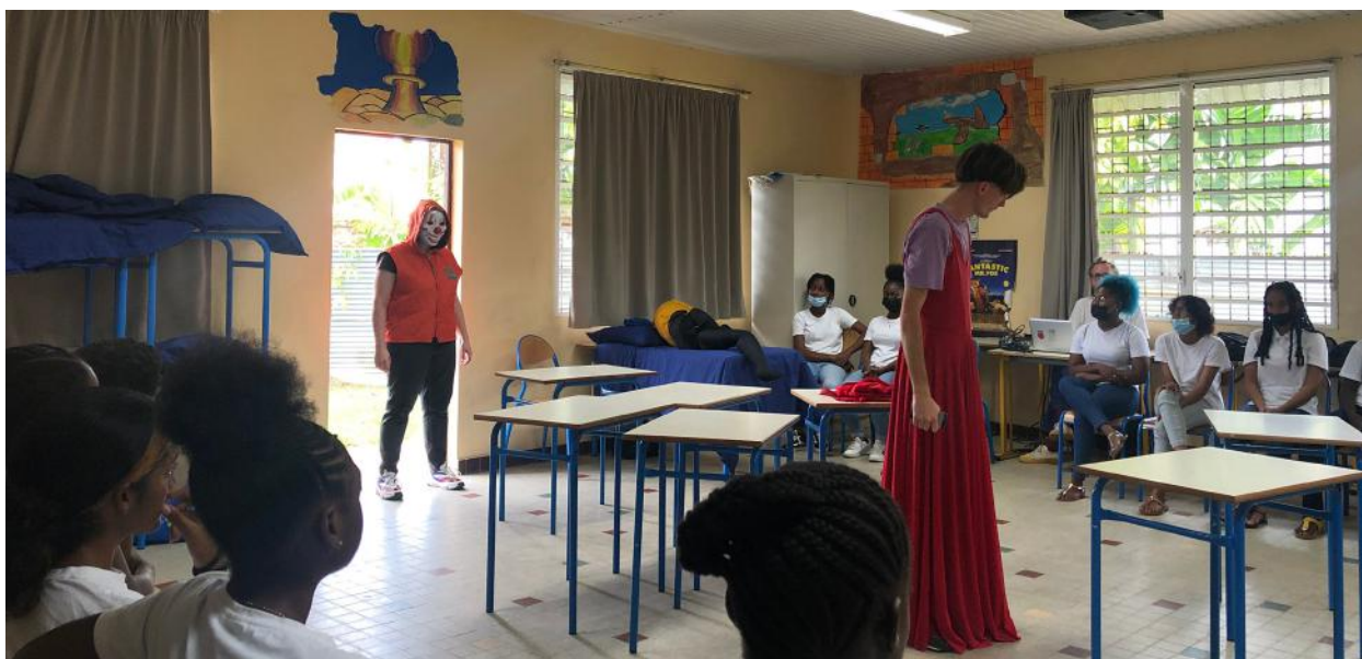
Représentation au collège Tell Eboué, Saint-Laurent du Maroni (Guyane)