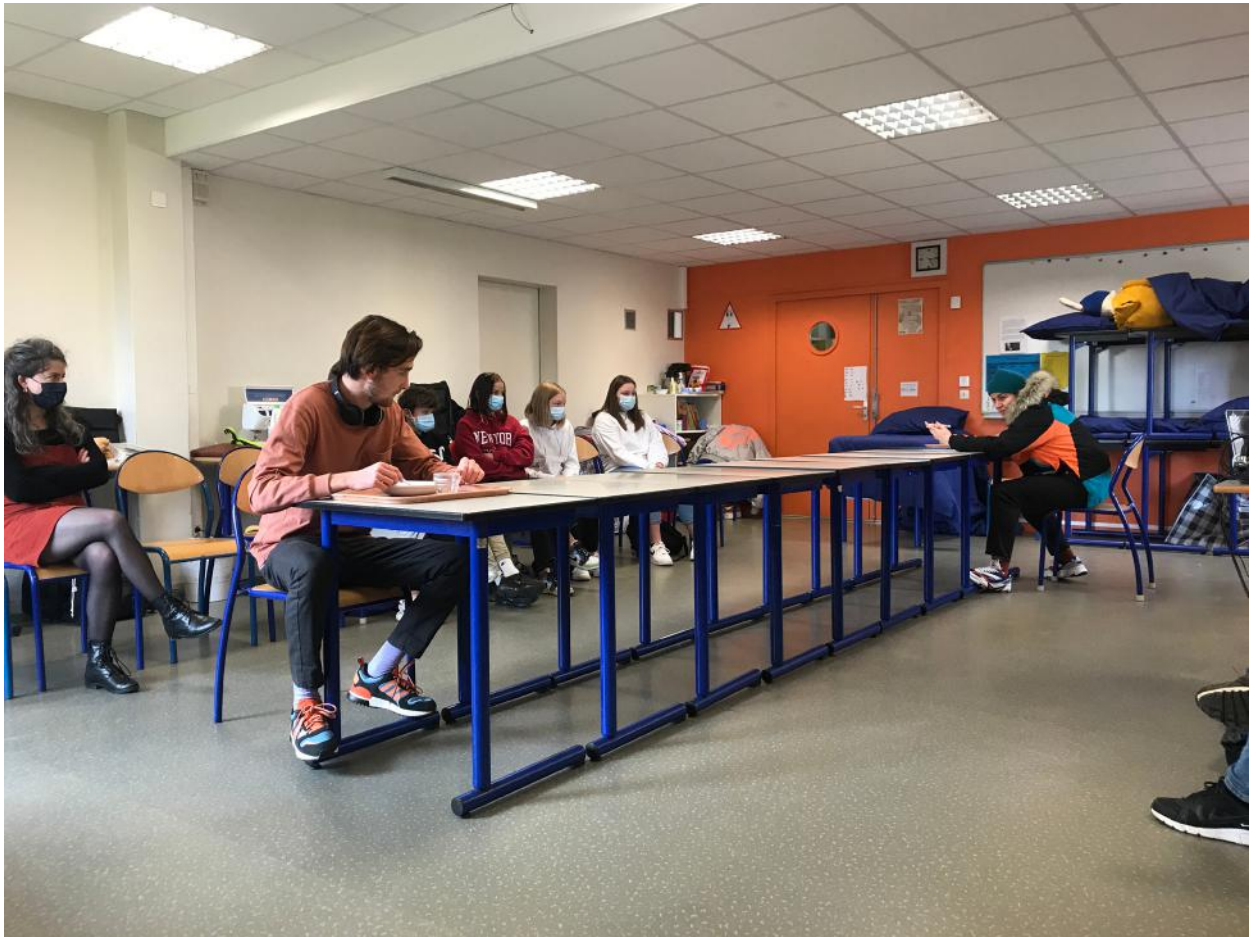
Répétition publique au collège Tancrede de Hauteville de Saint Sauveur Lendelin