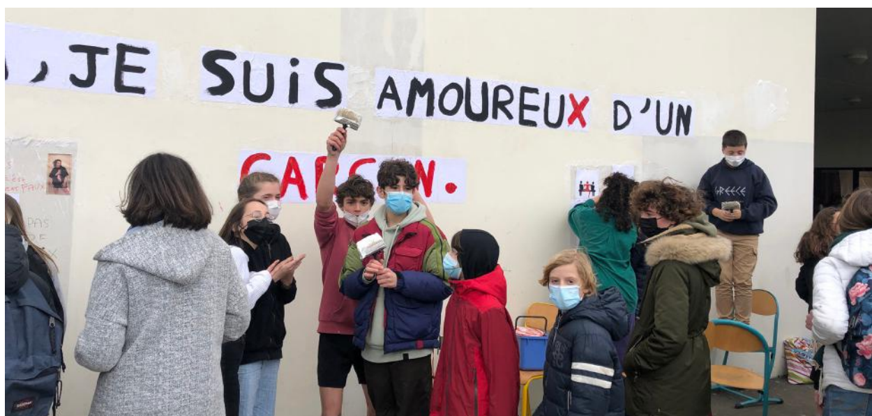
Séance de collage avec les collégien.nes du collège Letot, à Bayeux

La Compagnie les Grandes Marées propose une série d'actions culturelles autour des représentations (dossier sur demande). Une rencontre suit chaque date en salle de classe.