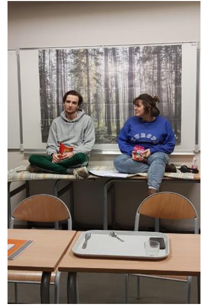
Répétition au collège Sévigné de Flers

une véritable incarnation sur son parcours. Cette déclinaison de personnages pour l'actrice nous permettra d'être inventif dans l'interprétation, les silhouettes, et le glissement de l'un à l'autre des rôles.