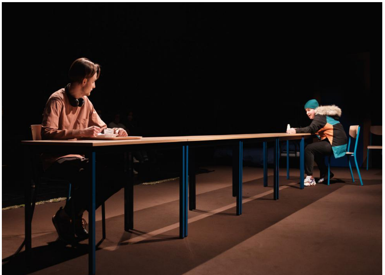
La même scène en version salle de spectacle